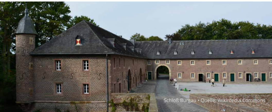
Schloß Burgau